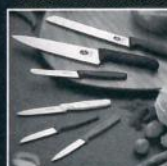
Kitchen & Chefs knives