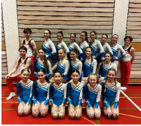
TurnerInnen K4 - 7

Nach unserem alljährlichen internen Wettkampf in der Sporthalle Lindenhof durften wir an einem gemeinsam Trainingstag mit der Geräteriege Wattwil noch an den letzten Details der neuen Übungen arbeiten.